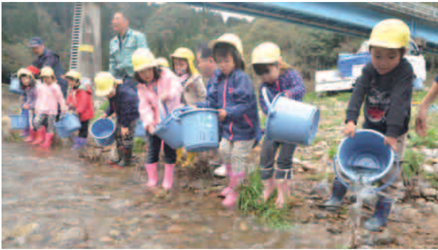
稚鮎を放流する園児の皆さん

因原保育所の年中、年長の園児が、因原の八面橋の下で稚鮎の放流を行いました。園児は江川漁協の組合員から鮎の入ったバケツを受け取り、「大きくなあれ」のかけ声と共に2千匹の元気な稚鮎を放流しました。