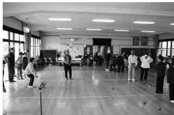
和気あいあいとペタンクを楽しむ会員の皆さん