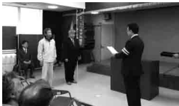
指定を受ける三原連合自治会代表

三原連合自治会（三原、田窪、南佐木、親和）が、高齢者を交通事故から守るモデル地区に指定されました。川本北公民館にて行われた指定式では、川本警察署副署長から指定書とのぼり旗の贈呈が行われました。