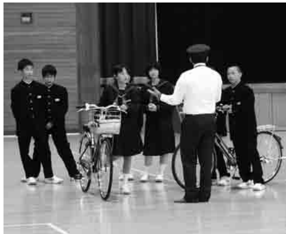
警察署の職員から説明を受ける生徒の皆さん

今春入学したばかりの1年生を対象に、交通安全教室が行われました。中学生のほとんどが自転車通学をしており、毎年この教室を開催しています。川本警察署の署員から、自転車が被害者にも加害者にもなること等を学び、その後、体育館で実際に自転車走行をし、正しい自転車の乗り方を学びました。