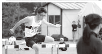
全力で競技する選手の皆さん

邑智郡陸上競技大会が、邑智郡公認陸上競技場である川本中学校グラウンドで行われました。