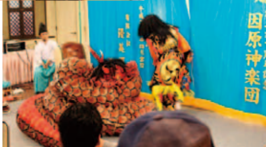
因原神楽による 石見神楽