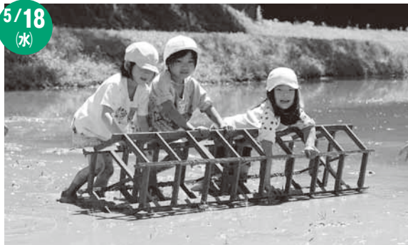
田枠を使って線を引く園児