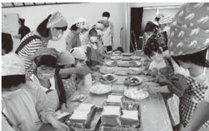
さあ、サンドイッチを作ろう!!