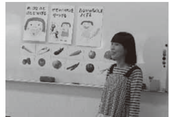
おいしくできたよ!!