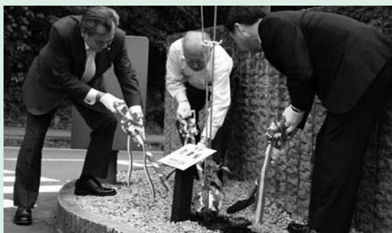
役場庁舎前 河津桜植樹の様子