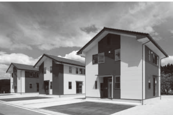
三原地区定住促進住宅(平成26年度建設)

助成額…参加旅費の2分の1(補助上限 東京都2万5千円、大阪府2万円、広島市1万円)