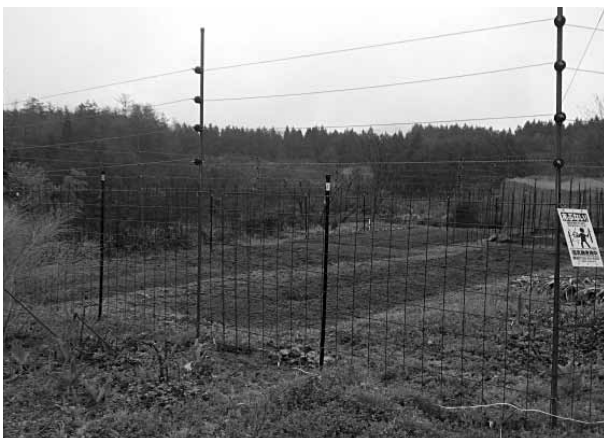
複合柵（電気柵+防護柵）設置写真