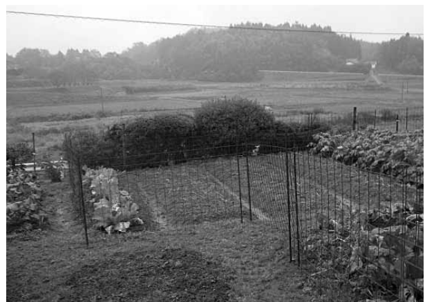
防護柵（ワイヤーメッシュ）設置写真