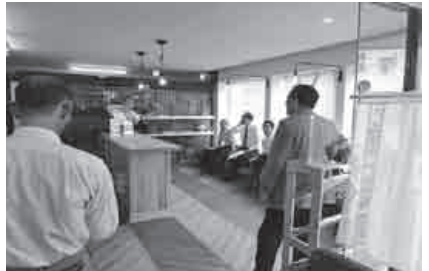
かわもと暮らし情報センター