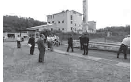
邑智クリーンセンター