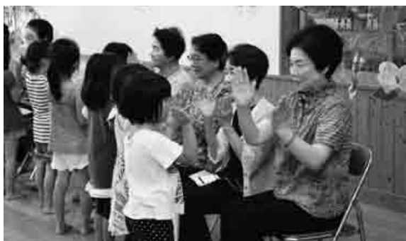
「たなばたさま」に合わせ手遊びをする弓市寿会会員と園児

地域交流を目的に、弓市寿会から12名の会員を招いて川本保育所で七夕会が行われました。園児が普段から町で声をかけてもらっていることへのお礼の意味も込め、毎年開催しています。園児や弓市寿会の皆さんがそれぞれ短冊に書いた願い事を紹介したり、手遊びをしたりして交流しました。「歩けるようになったらお兄ちゃんお姉ちゃんと一緒に散歩したい」「魔法使いに会いたい」など、かわいらしい願い事も紹介されました。七夕会の後はそうめん流しの会食を楽しみました。