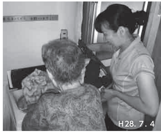
H28. 7. 4

「住み慣れたわが家で暮らしたい」 独居で生活する高齢者と、それを支えるホームヘルパー（やすらぎ荘訪問介護事業所在籍）