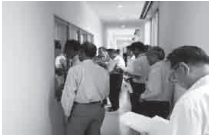
学校給食センター