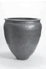
石見焼大甕 (石見陶器工業協同組合所蔵)