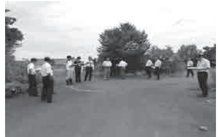
三原小学校跡地（企業誘致推進事業）