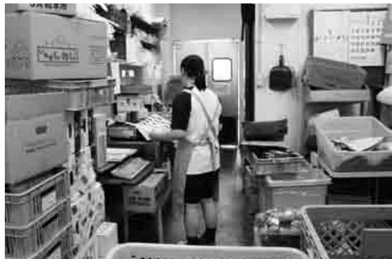
スーパーで職場体験をする島根中央高校生

職場体験を通して、社会の一員として必要な心構えを身につけ、将来地域で活躍する人材の育成を目的とした「まちごとキャンパス学習」が行われています。島根中央高校の一部の2年生が対象で、本年度は町内の17事業所が24名の生徒を受け入れています。テスト期間や夏休みなどを除き、来年1月下旬まで、毎週1時間半程度職場体験をしています。事業所や町で見かけた際には温かい声がけをお願いします。