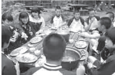
野外での食事の様子