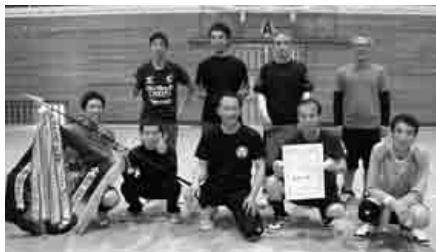
男子優勝 因原Aチーム