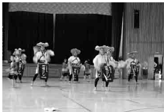
勇壮な演舞を披露する参加者

泥落とし行事として、三原地区で田植ばやしが行われました。三原田植ばやしは戦国時代から同地区に伝わる伝統行事です。当日はあいにくの雨により室内での開催となりましたが、田植ばやし保存会の会員を中心に、地元の有志や小中学生が演舞を披露しました。