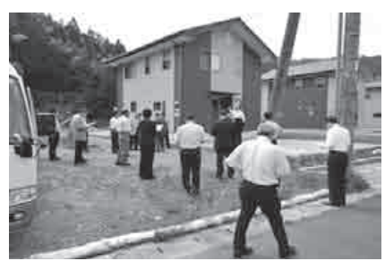
木路原地区定住促進住宅