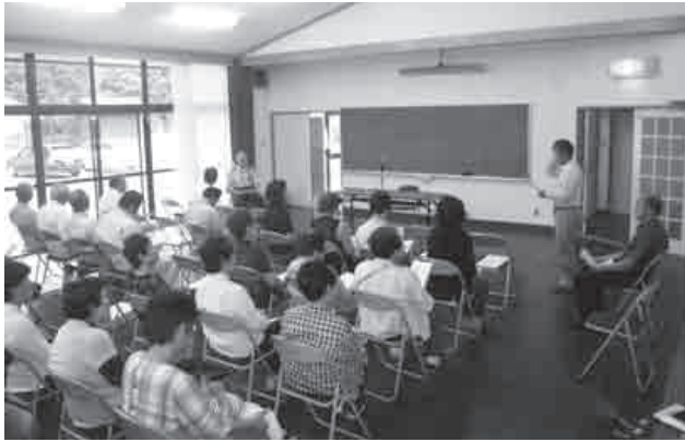
災害避難訓練（田窪自治会館）

あった防災マップ、避難経路、非常食の量なども検討し、現状に沿ったものにする。町民の生命、財産を守る体制づくりをさらに推し進めていく。 ◎その他の質問 ● 介護予防・日常生活支援総合事業への移行について。 ● 株式会社三協の工場進出に伴う地域活性化対策について。 ● 小規模企業振興基本法について。 ● ふるさと思いやり基金について。