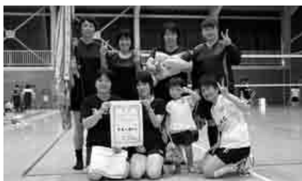
女子優勝 本町チーム

第41回川本町親睦バレーボール大会が川本中学校体育館で行われ、参加者同士交流を深めました。