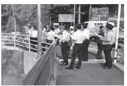
川本大橋三島側歩道整備