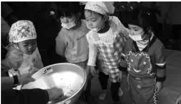
おいしい味噌にな～れ

農事組合法人“なかごく楽農一家”さんによる、『味噌づくり体験』が田窪自治会館で行われ、今年も家族連れを中心に大人から子ども約30人が参加しました。