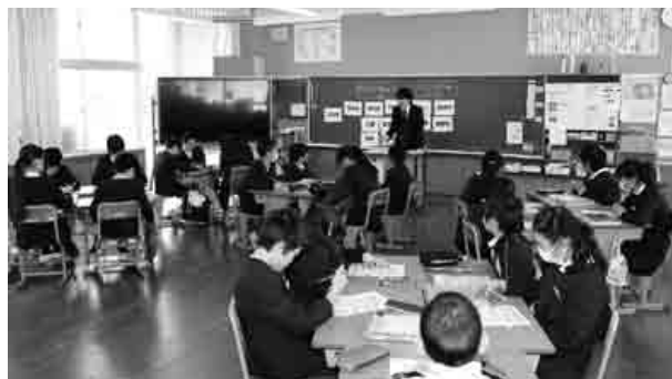
身近な税金について学ぶ児童たち