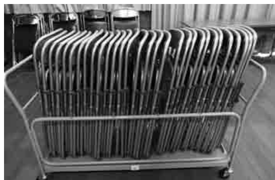
パイプいすと台車 など

平成30年度の募集は終了していますが、今後整備を検討されている団体(自治会に限りません)はお気軽にお問い合わせください。