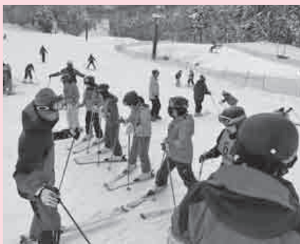
三瓶(大田市)、琴引(飯南町)で開催されたスキー交流

3月25日(日)には坂町悠々健康ウォーキングが開催されます。川本町からも多くの方の参加を心待ちにしております。