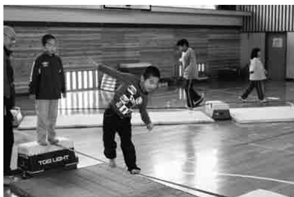
全身でバランスをとることが大事

教育委員会によるK-POP事業『スラックライン体験』が、川本小学校・体育館で行われました。