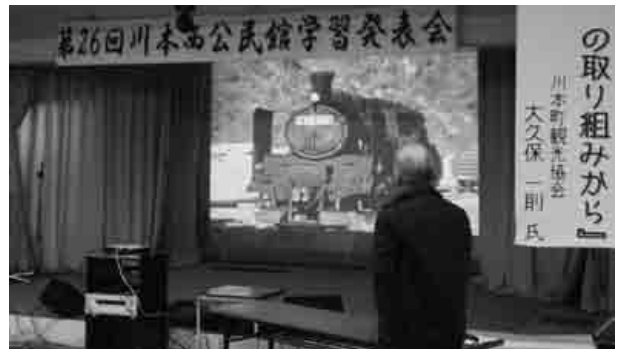
昭和48年に三江線を走ったSLの映像

川本西公民館で『第26回学習発表会』が開催され、普段、西公民館で活動されているグループの皆さんが日ごろの練習の成果を発表されました。