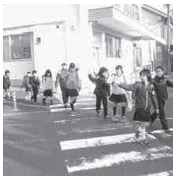
この子ども達に託したい