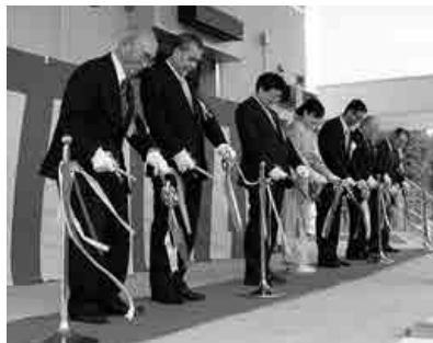
三協・川本町・島根県の関係者らによるテープカット

平成30年4月13日（金）川本町大字南佐木の旧三原小学校グラウンドで、株式会社三協島根川本工場の竣工式が行われました。式典は、三協・川本町・島根県の関係者によるテープカット、地元の方々の手作り料理や三原神楽団の『恵比須』で、川本町では56年ぶりの誘致企業の進出に盛り上がりを見せました。式典後には、完成した工場内の一般公開もあり、多くの町民の方が訪れました。 操業開始後には、町出身者を含む多くの従業員の方がこの工場に働き、町の新たな雇用の場として期待されています。