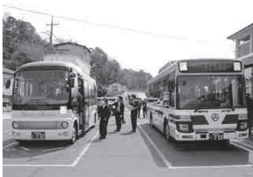
三江線代替交通バス

国民健康保険事業、後期高齢者医療、住宅新築資金等貸付事業、簡易水道事業及び農業集落排水処理事業の特別会計の総額は、10億79万6千円で、対前年度1億5、962万3千円、13・8%の減となっております。この主な要因は、簡易水道事業における建設改良費等の減額によるものです。