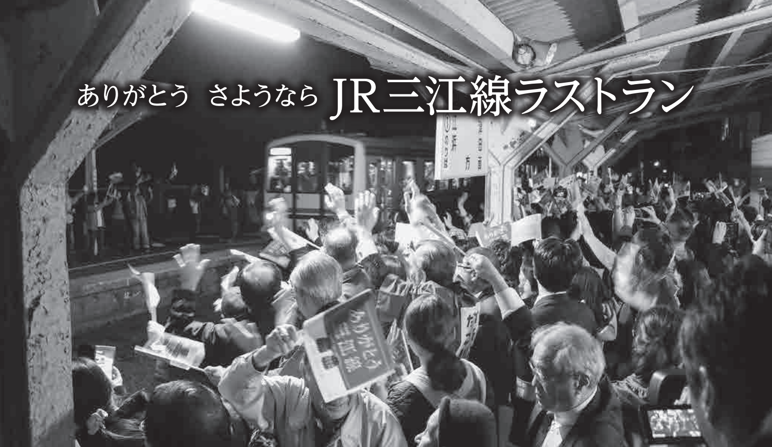
石見川本駅のホームで最終便20時18分発浜原行を見送る大勢の人々

平成30年3月31日（土）。ついに、JR三江線最後の運行日を迎えました。石見川本駅周辺で行われた『ラストランイベント』には、最後の雄姿を見ようと地元の方々と鉄道ファンなど、町内外から多くの人々が訪れました。 当日は朝から清々しいほどの快晴で、石見川本駅前には、昼12時のイベント開始前から多くの人々が集まっていました。 石見川本駅を発着するどの列車も定刻より遅れ、車内には溢れんばかりの多くの乗客の姿。また、線路沿いの道路や堤防では、歴史的瞬間を収めようとカメラを構える人々も多く見られました。 ホームでは、江川太鼓や島根中央高校吹奏楽部の演奏、「ありがとう三江線」と書かれた横断幕による出迎え、見送りが行われ、町全体で三江線への感謝を伝えました。また、最終便の出発前には駅待合室を会場にセレモニーが開催され、運転士さん、石見川本駅の駅員さんに花束が贈呈されました。 最終便の出発では、駅のホームにこれまで見たこともないほどの人々が集まり、手旗を振って列車に声を掛けていました。暗闇に遠ざかる車窓の明かり、赤いテールランプが見えなくなるその時まで、見送り続けました。