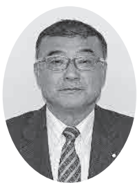
副議長 片岡 通泰