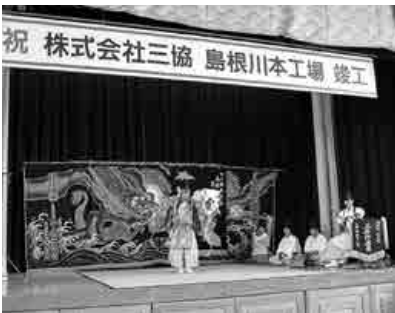
三原神楽団による石見神楽『恵比須』で式典に花を添えた