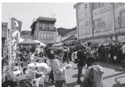
多くの人でにぎわう石見川本駅前