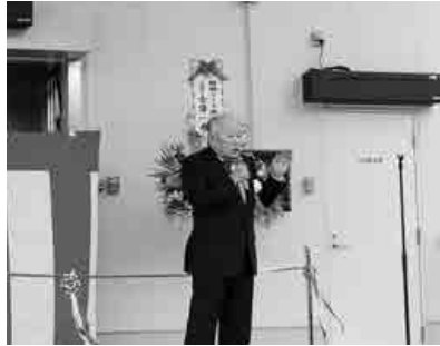
川本町への進出、工場完成の思いを語る三協・石川社長