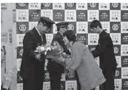
運転士さん、駅員さんへの花束贈呈