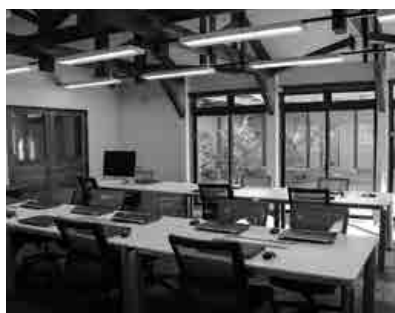
旧音楽研修棟内をテレワークスペースに改修拠点のパソコン等を使用し業務を行うこともできる