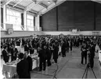
式典には地元の方々、三協社員、工場建設に関わった事業者の方々が参加