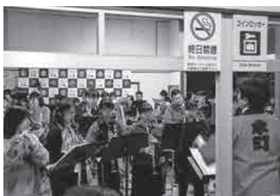
江川太鼓、吹奏楽の演奏によるお出迎え・お見送り