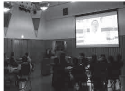
恩師からのビデオメッセージ