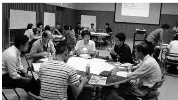
中山間地域の明るい未来を描いて

9月1日（土）中国経済産業局と川本町による共催で『地方創生実現に向けた地域コミュニティの在り方ワークショップ』が開催されました。