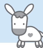
マスコットキャラクター まごころば