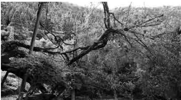
倒木によりふさがれた木路原地内の道路