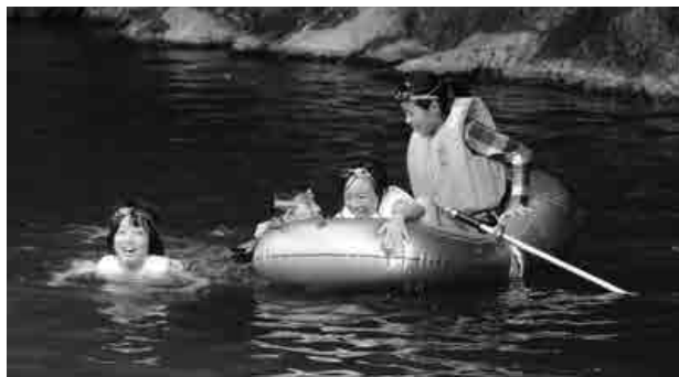
自然の川で水遊び

今年も『かわもとSUMMERキャンプ』が、8月9日（木）から11日（土）にわたり行われ、小学校4～6年生18人が参加しました。