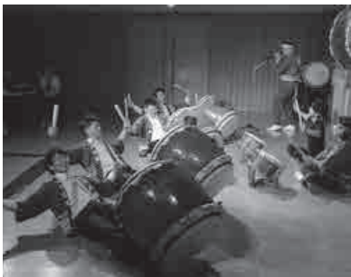
中学校の文化祭で披露した江川太鼓に飛び入り参加