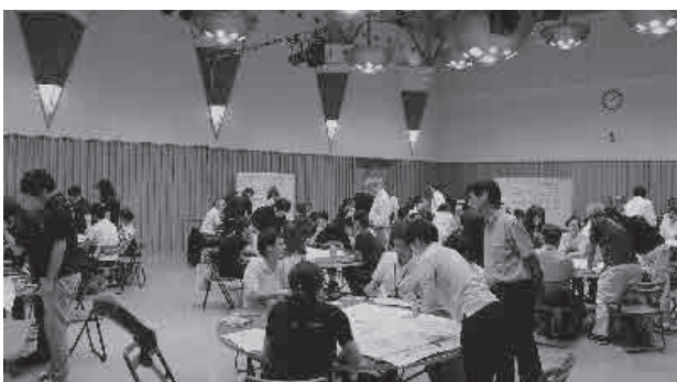
将来の弓市について語り合いました

町の中心市街地である“弓市”のこれからを考える『弓市魅力化ワークショップ』が、悠邑ふるさと会館・マルチホールで開催されました。