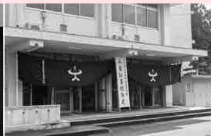
3年間を過ごした校舎ともお別れ