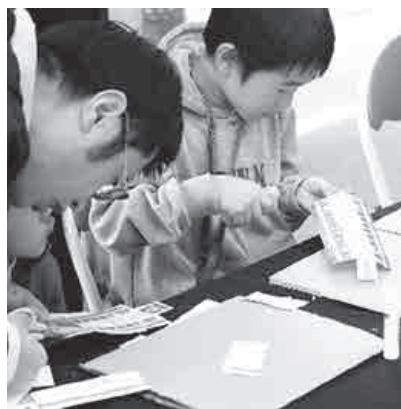
緑日コーナー（1回100円）