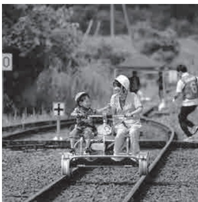
レールバイク（1回300円） ※予約受付中