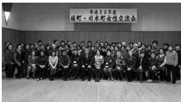
絶えることない交流で更なる絆を

姉妹都市である広島県坂町と川本町による『平成30年度坂町・川本町女性交流会』が、悠邑ふるさと会館・マルチホールでありました。