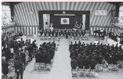
大きな声で最後の校歌

3月15日（金）に挙行政された『平成30年度川本小学校卒業証書授与式』では、卒業生25人が6年間過ごした小学校を旅立ちました。まだ幼さが残っていた入学式から、今では凛々しいお兄さんお姉さんになりました。皆さんの更なる成長をお祈りします。