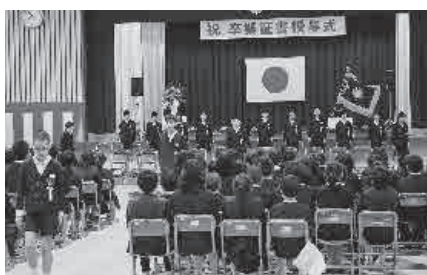
もう立派なお兄さん・お姉さんです