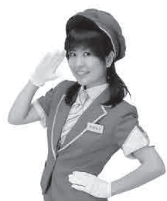
元祖鉄道アイドル 木村裕子もやって来る！