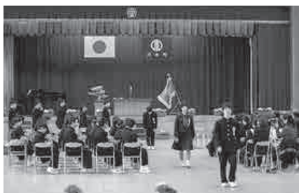
それぞれの思いを胸に旅立ちます