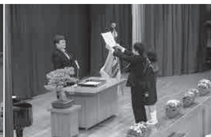
一人ずつ受け取る卒業証書