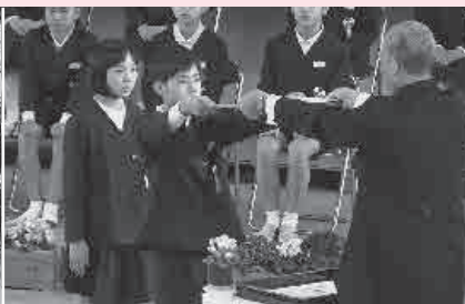
6年間よくがんばりました