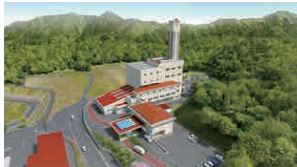
2022年度当初供用開始予定