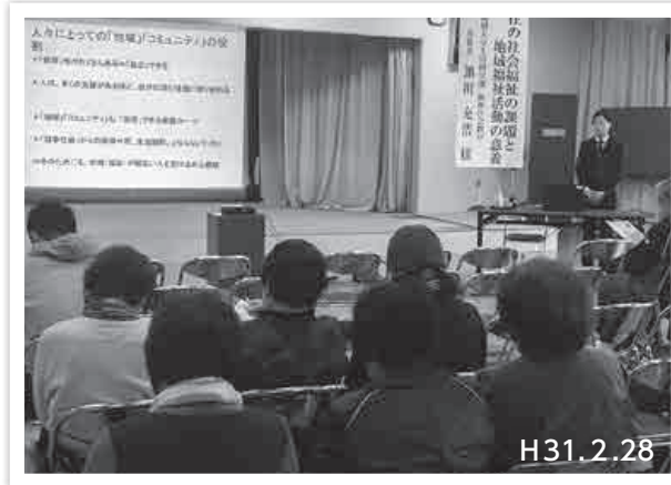
講師から支え合いの話を聞く参加者の皆さん

「ぬくもり写真館」連載終了のお知らせ 3年間にわたり、このコーナーを連載 させていただきましたが、この3月号を もって、連載を終了させていただきます。 まだまだ取り上げたかった素敵な取組が 川本町にはたくさんあります。今後も、 私たちは身近な人の温かさを感じ、お互 いを大切に合っていけたらと思ってい ます。長い間、ご覧いただきありがと うございました。