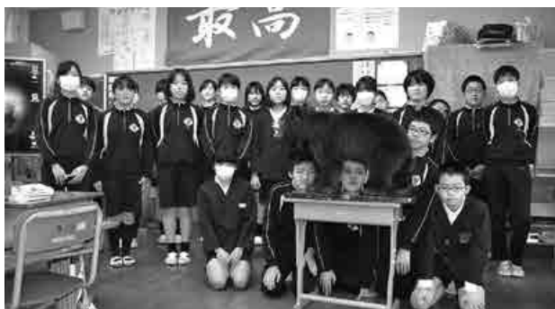
人も動物も住みやすい環境づくりを

川本小学校6年生の環境の時間に、「川本町に住む動物たち～野生動物との付き合い方～」と題して出前授業が行われました。