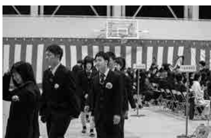
期待に胸を膨らませ新たな道へ