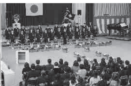
家族・先生・地域の方々へお礼の言葉