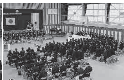
在校児童からお別れの言葉