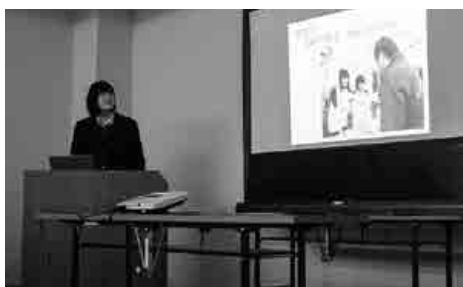
高校生活を通しての経験を 将来の夢につなげます