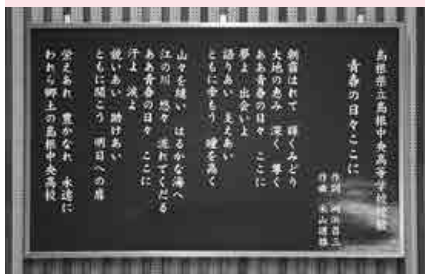
仲間と歌う最後の校歌

3月1日（金）には『平成30年度島根県立島根中央高等学校卒業証書授与式』が挙行されました。県内外から集まった85人の卒業生は、第10期という節目の学年となりました。高校3年間の経験を糧に、進学や就職などこれから新たな道を歩みます。