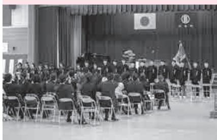
卒業生による式歌「旅立ちの日に」

3月10日（日）『平成30年度川本中学校卒業証書授与式』が挙行政され、卒業生22人が慣れ親しんだ学び舎をあとにしました。当日はあいにくの雨模様となりましたが、卒業生は皆この晴れの門出で堂々とした姿をみせてくれました。