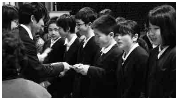
これからも読書を続けてね

川本小学校で行われている朝の読み聞かせボランティア活動が、今年度の最終回に合わせて『読み聞かせスペシャル』として開催されました。この活動は、毎月2回、町内の読み聞かせグループを中心に役場や教育委員会の職員が全学年を訪れ、読書に慣れ親しむ機会として取り組んでいます。