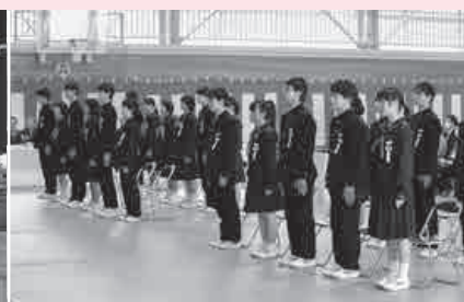
22人全員そろっての卒業式