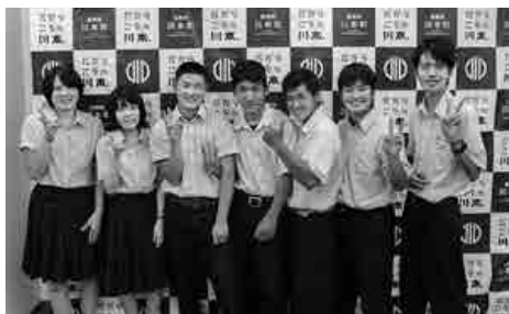
皆さんが川本町でご活躍される日を 楽しみにしています

川本町では、高校を卒業して進学や就職等で川本町を離れ、それぞれの道で学んだことや経験を活かし再び川本町に戻り活躍することを目指す生徒たちを応援する「川本町夢と可能性に挑戦する人財定住助成金事業」に取り組んでいます。 今年度もこの事業を活用し、生徒自身が将来の夢や目標を考え発表する『自分計画書発表会』が行われました。昨年度は、島根中央高校生徒4人が発表しましたが、今年度は2回開催し11人の生徒による発表が行われました。