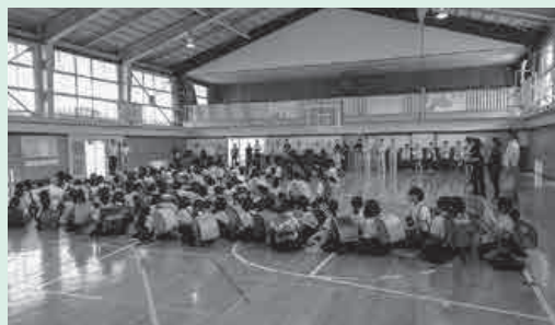
登校班に分かれて下校