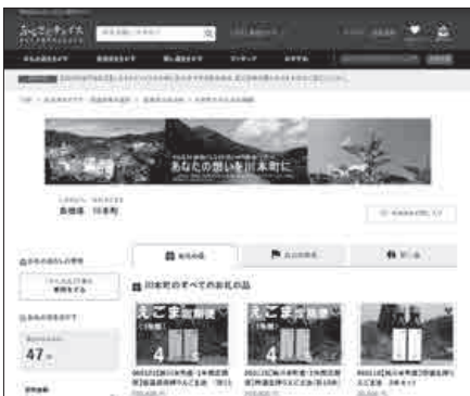
ふるさとチョイスの川本町ページ