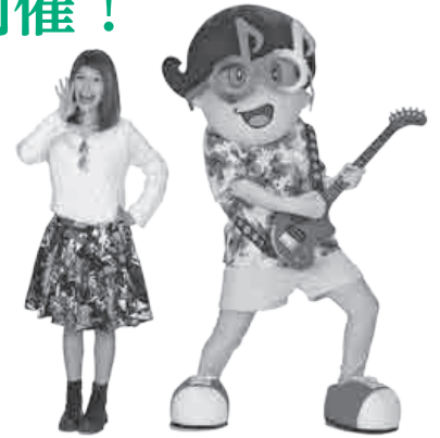
ゲスト ゆり&ドゲナッチョ

江の川では、恒例の『第68回江の川名物花火大会』も開催し、約2,500発の大輪の花が夏の夜空を彩り、山々に響き渡ります。ぜひ、お楽しみください♪