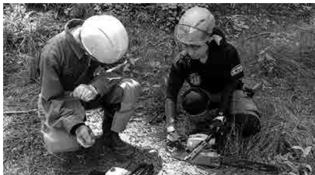
正しい知識で安全な作業を

川本町の林業の担い手育成を支援するため、「山をしり、林とかかわる基礎講座」と題したチェーンソーを使った研修会の第1回目を、北公民館と最寄りの町有林にて行いました。