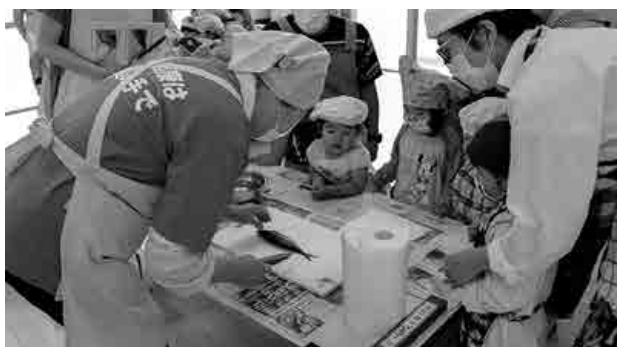
アジをさばく様子に興味津々の子供たち

因原保育所で『親子クッキング』が開催され、園児と父兄が旬の食材に触れながら料理を楽しみました。