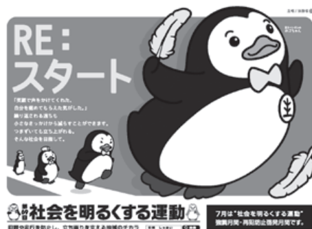
第69回社会を明るくする運動

「社会を明るくする運動」は、すべての国民が、犯罪や非行の防止と罪を犯した人たちの更生について理解を深め、それぞれの立場において力を合わせ、犯罪のない地域社会を築こうとする全国的な運動です。