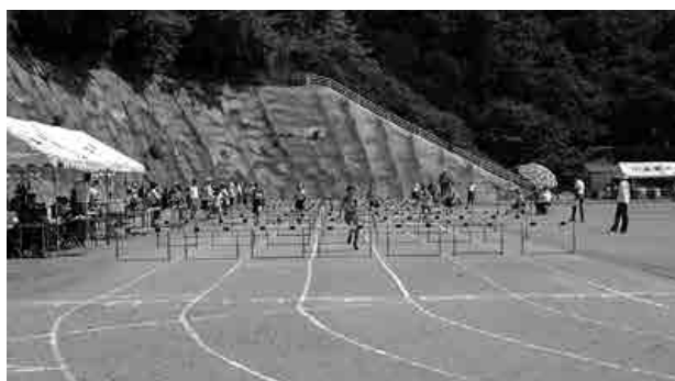
全力で競技する選手の皆さん

『第74回邑智郡陸上競技大会兼第47回邑智郡小学校陸上競技大会』が開催されました。