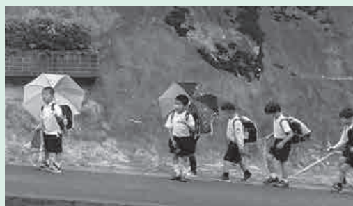
子どもたちが安全に通学できるよう点検しています