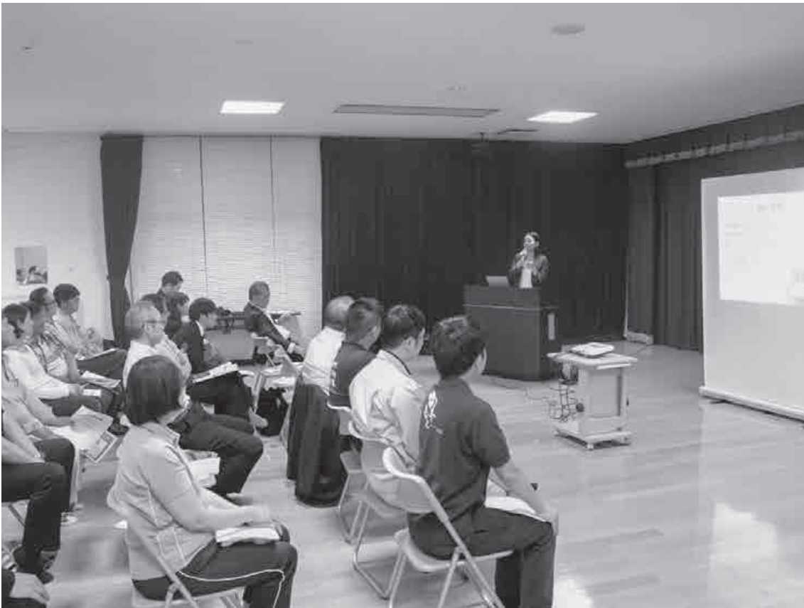
5月24日（金）、すこやかセンターかわもとで行われた「地域おこし協力隊活動報告会」では、任期3年目と任期満了を迎えた隊員による発表が行われました。