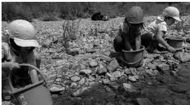
大きく育てて帰ってきてね

因原保育所の子どもたちによる『稚アユの放流』が江の川支流の濁川で行われ、4～5歳児9名が自分たちの手で稚アユを川に放流しました。