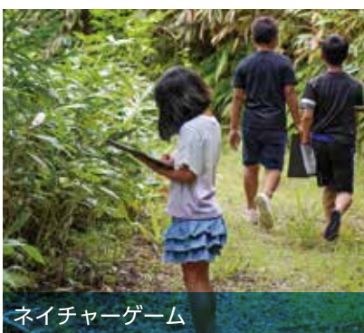
ネイチャーゲーム

苔が生きていることが分かりました。苔は種類がたくさんあるんだなと思いました。(4年生女子)