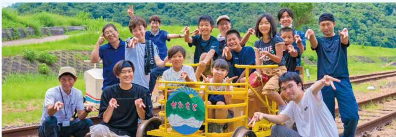
レールバイクでは2kmもこいだけど、いろいろな景色を見ることができてよかったです。(5年生男子)