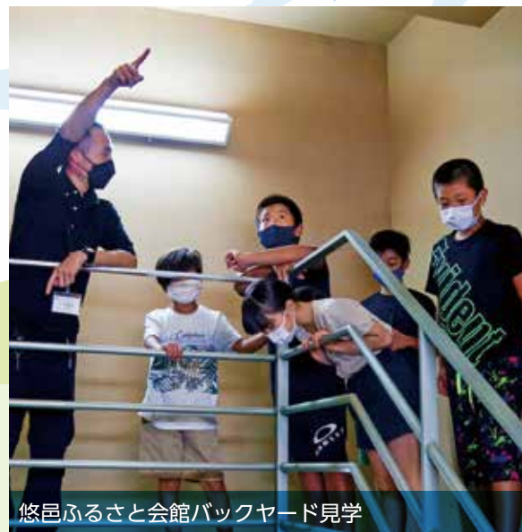
悠邑ふるさと会館バックヤード見学

ふるさと会館のバックヤード見学では、階段を上がっていくといつの間にか20mくらいのところまで来ていました。そして、橋を渡ると下が見えてそわそわしました。こわかったけど、ふるさと会館の知らないことを知ることができてよかったです。(5年生男子)