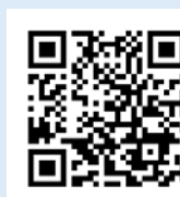
ふるさとチョイス 楽天ふるさと納税