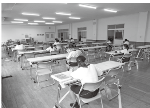
子育てサポートセンターの様子