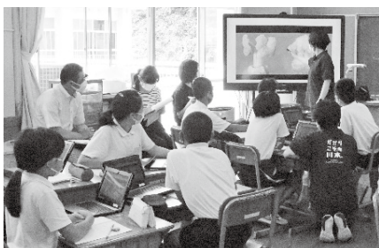
タブレット端末を使用した小学校の授業風景

この計画において、教育の情報化について4つの施策を掲げている。1つ目に「情報教育の充実」、2つ目に「教科指導におけるICT活用の推進」、3つ目に「校務の情報化の推進」、4つ目に「情報化の推進体制」。これらに取り組むことによって、本町では、将来の予測が難しい社会において、情報や情報技術を主体的に選択して活用し、他者と協働しながら新たな価値を創造する子どもを育成を目指していく。