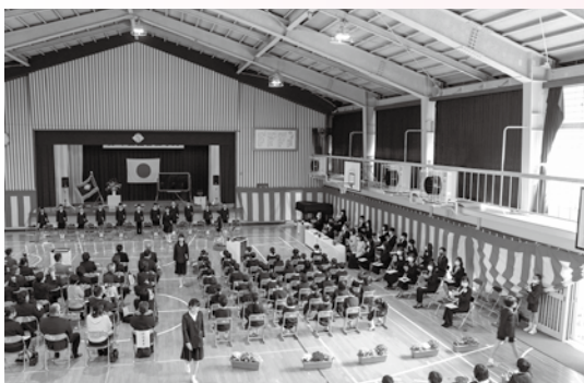
大きく成長した姿で中学校へと進みます