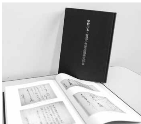
『中世川本・石見小笠原氏関係史料集』 A 5判・342ページ 5,000円(税込)

本書は、石見小笠原氏に関する史料を活字化し簡単な要約を付けているほか、写真や花押 かおし と呼ばれる署名の代わりに使われた記号・符号の一覧など、歴史の実態が解明される初めての史料集となっています。