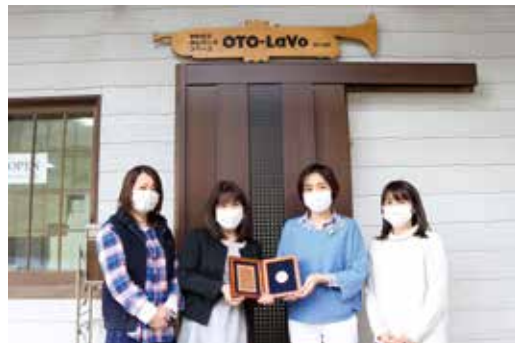
金築社長(左から2番目)とワーカーの皆さん

受賞した金築社長は、「この施設が仕事を通じた交流の場となり、もっと多くの方に利用してもらえるよう取り組んでいきたい。」と語られました。