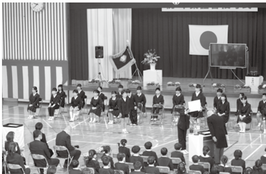
校長先生から受け取る卒業証書