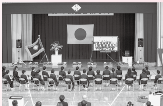
在校生からのビデオメッセージ