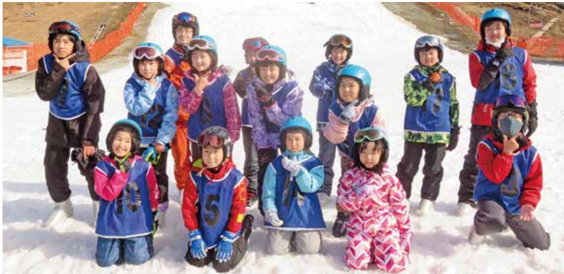
2/28 (日) 川本町親子スキー交流

2月28日(日)に琴引フォレストパークスキー場(飯南町)で『川本町親子スキー交流』が開催され、町内の小・中学生と保護者19人が参加しました。新型コロナウイルスの影響により、恒例の広島県坂町との交流会やイベント等が中止となる中、関係団体の協力により実現しました。子どもたちの中には初めてスキーをする子もいましたが、みるみる上達して一人でも滑れるようになり、冬しかできない体験を楽しみました。