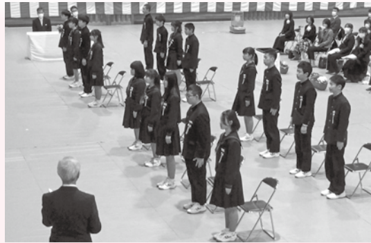
17人揃っての卒業式