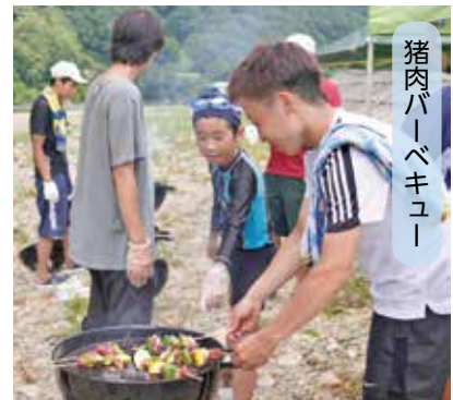
猪肉バーベキュー