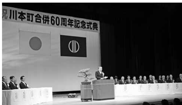
平成27年10月 川本町合併60周年記念式典