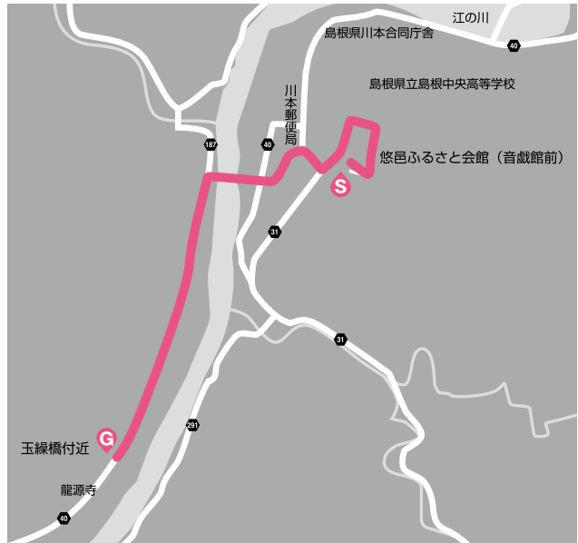
▲川本町聖火リレールート

【問】島根県スポーツ振興課 ☎0852-22-6439 総務財政課 ☎72-0631