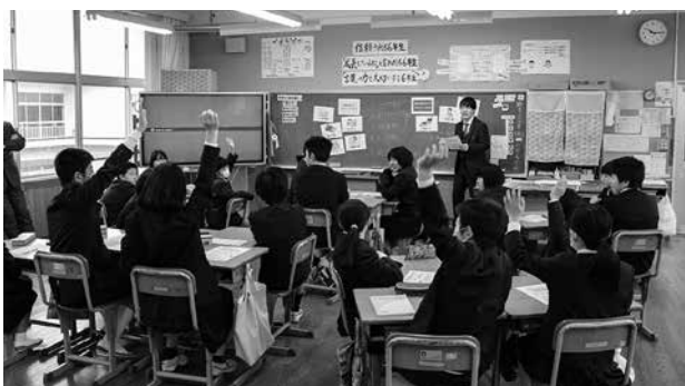
楽しく正しく大事な税金を学習

川本小学校6年生の授業で、自分たちの暮らしの中にある税金について学ぶ『租税教室』が行われました。