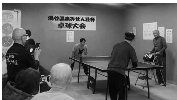
熱戦を繰り広げた卓球大会