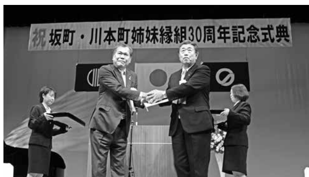
平成28年10月 坂町姉妹縁組30周年記念式典