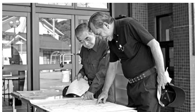
平成30年7月 豪雨災害の復旧に尽力