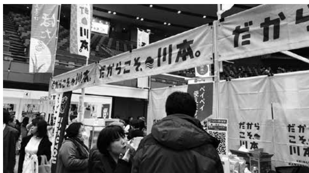
町外・県外の方に川本町をPR

広島グリーンアリーナ（広島市中区）で開催された『島根ふるさとフェア2020』に川本町も出展しました。