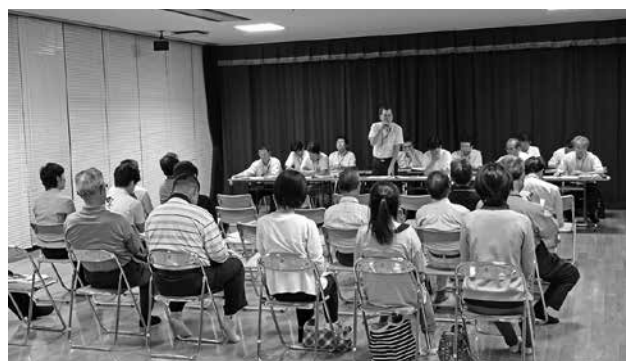
平成25年～ まちづくり意見交換会