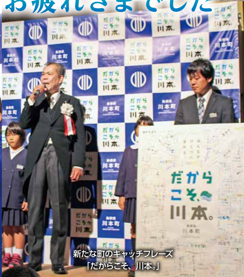
新たな町のキャッチフレーズ 「だからこそ、川本。」