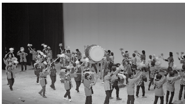
フィナーレは地域婦人会と江川太鼓による「中国太郎」

町内の芸能団体が構成する川本町音楽芸能協会による『第33回川本町音楽芸能祭』が、悠邑ふるさと会館・大ホールで開催されました。