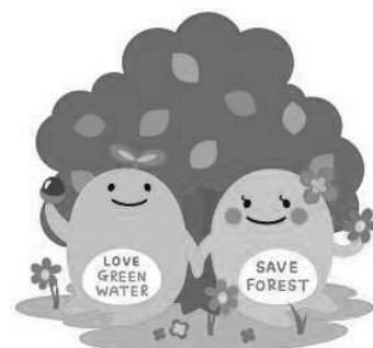
水と緑の森づくりキャラクター みーもくん・みーなちゃん