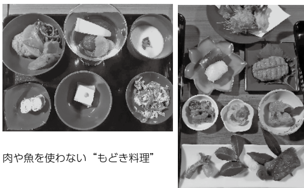
肉や魚を使わない“もどき料理”

湯谷温泉弥山荘による『精進料理体験会』が、施設隣の長江寺(湯谷)で開催されました。