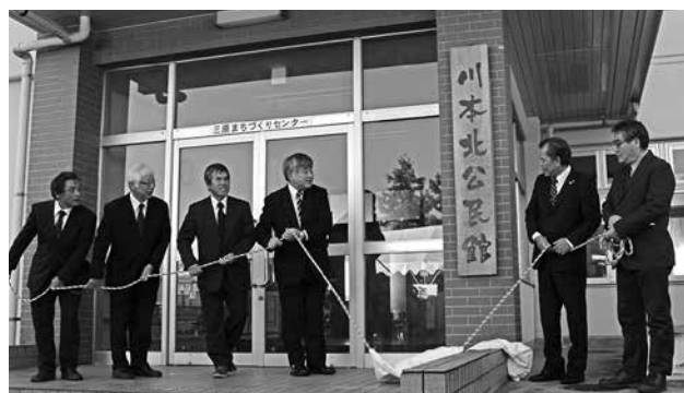
平成28年11月 三原まちづくりセンター・北公民館開所