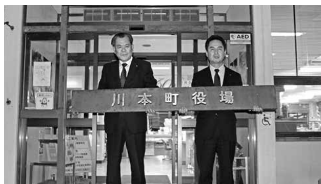
平成27年12月 川本町役場庁舎移転