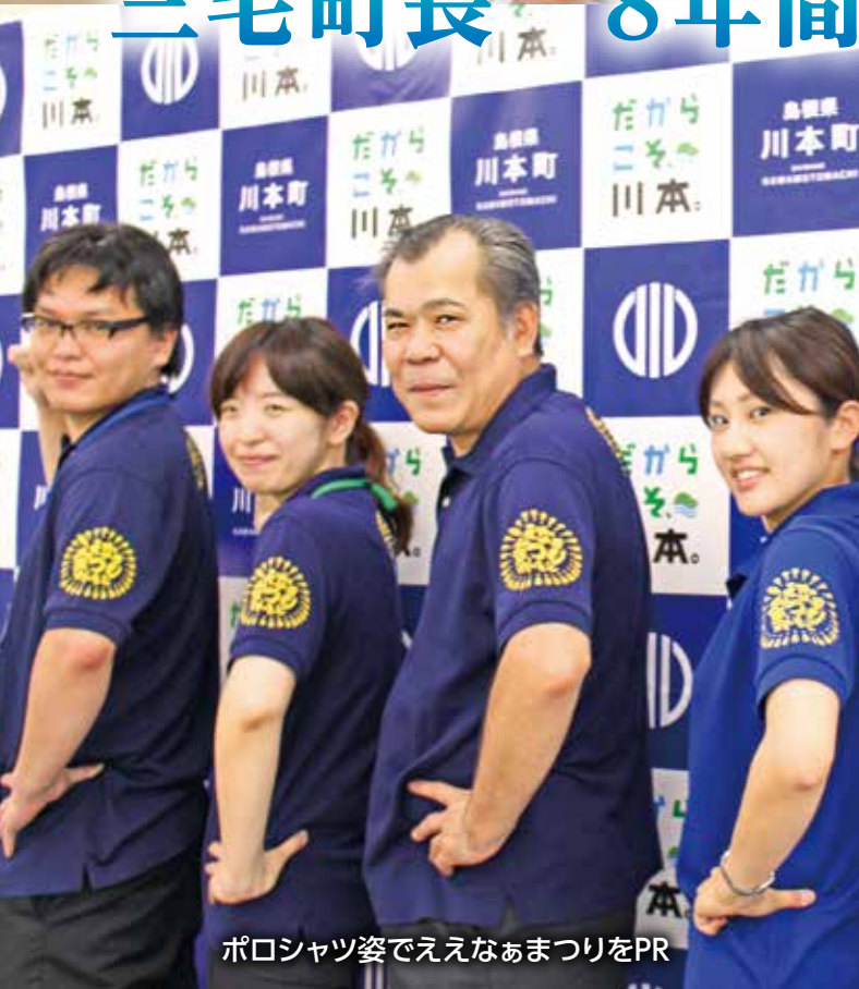
ポロシャツ姿でええなあまつりをPR