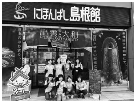
自分たちの手で完売できました

にほんばし島根館（東京都中央区）で、小中学生8人による川本の新しいお土産「かわもと手焼きせんべい」の販売会が行われました。これは、ふるさと納税型クラウドファンディングを活用した取り組みで、せんべいは、町内事業所協力のもと子どもたちが一緒に企画・製造に携わりました。