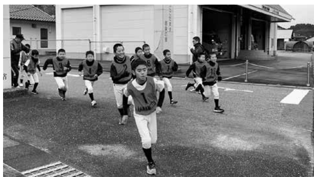
今年1年のスタートダッシュ

1月19日（日）、年間を通じて川本町の四季折々のコースを楽しむことができる『かわもとウォーキング』“冬”が開催されました。