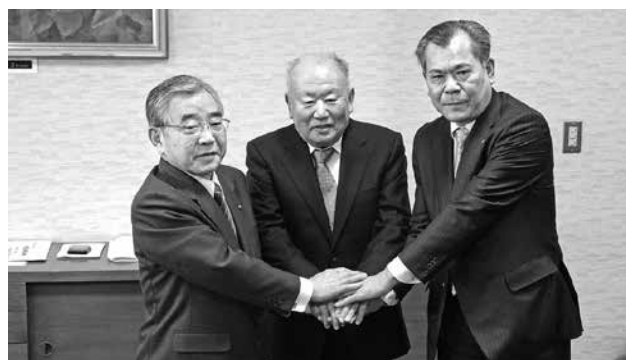
平成30年4月 三原地区で(株)三協川本工場操業開始