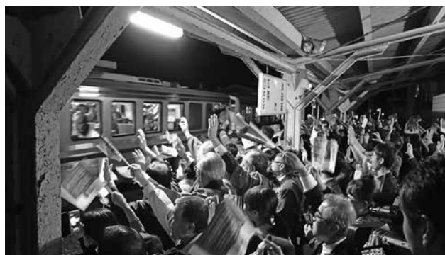
平成30年3月 三江線ラストラン