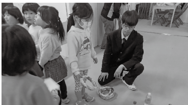
高校生と一緒に輪投げに挑戦する子どもたち

島根中央高校では「ふるさと学」という地域で学ぶ授業に取り組んでいます。その授業の一環で、12月から4回にわたってカフェ・オレンジ(元町)を会場に、2年3組の生徒による『ふるさと学サロン』を行いました。サロンは、地域の現状を学び、地域の皆さんとの交流を目的に企画しています。