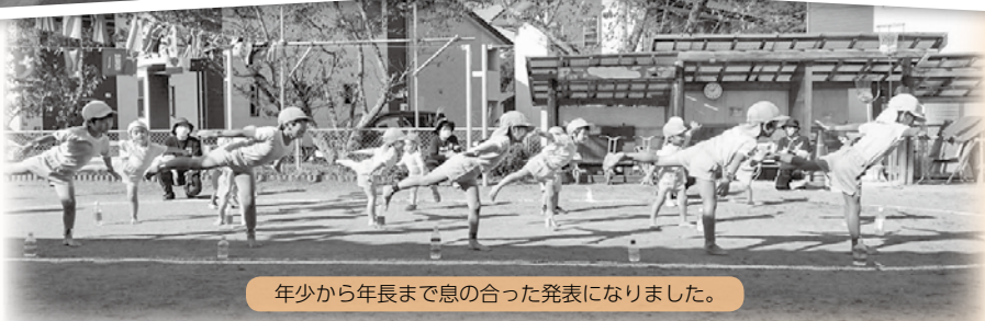
年少から年長まで息の合った発表になりました。