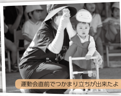
運動会直前でつかまり立ちが出来たよ！