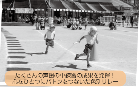
たくさんの声援の中練習の成果を発揮！心をひとつにバトンをつないだ色別リレー