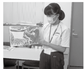
読み読みの練習をしました