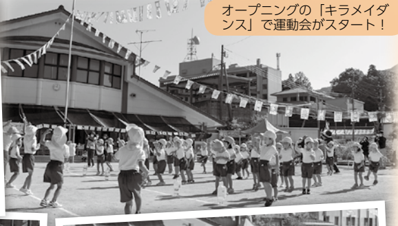
オープニングの「キラメイダンス」で運動会がスタート！