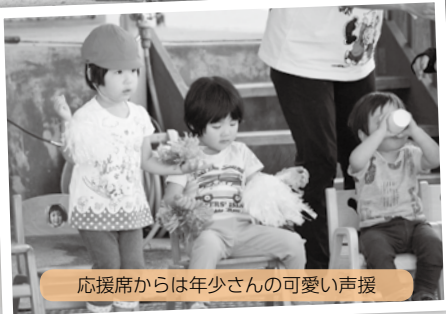
応援席からは年少さんの可愛い声援