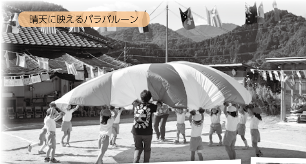
晴天に映えるパラバルーン