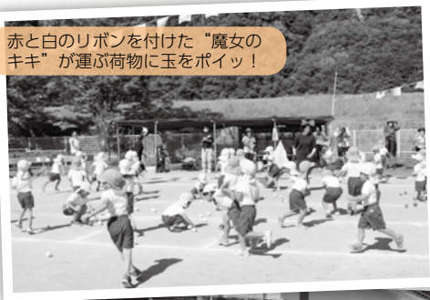
赤と白のリボンを付けた“魔女のキキ”が運ぶ荷物に玉をポイッ！