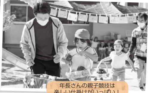
年長さんの親子競技は楽しい仕掛けがいっぱい！