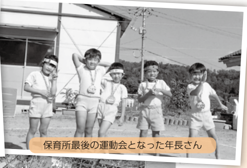
保育所最後の運動会となった年長さん