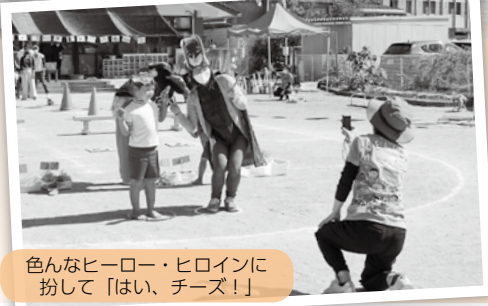
色んなヒーロー・ヒロインに扮して「はい、チーズ！」