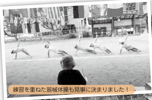
練習を重ねた器械体操も見事に決まりました！