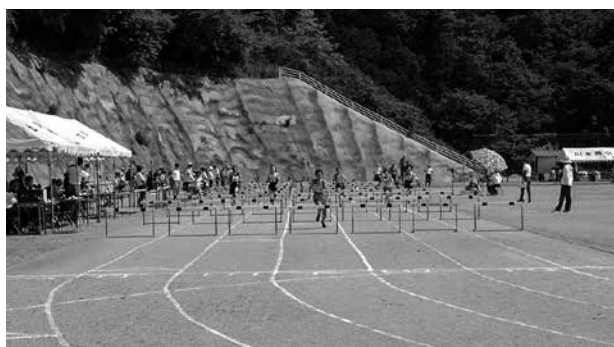
全力で競技する選手の皆さん

『第74回邑智郡陸上競技大会兼第47回邑智郡小学校陸上競技大会』が開催されました。