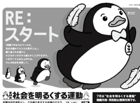
第69回社会を明るくする運動

「社会を明るくする運動」は、すべての国民が、犯罪や非行の防止と罪を犯した人たちの更生について理解を深め、それぞれの立場において力を合わせ、犯罪のない地域社会を築こうとする全国的な運動です。