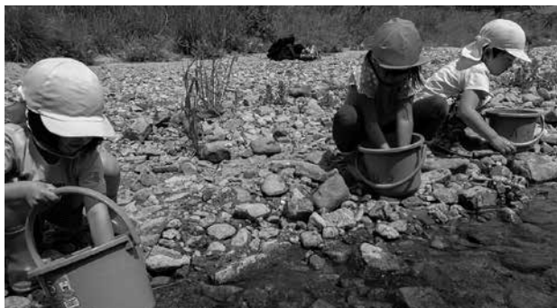
大きく育てて帰ってきてね

因原保育所の子どもたちによる『稚アユの放流』が江の川支流の濁川で行われ、4～5歳児9名が自分たちの手で稚アユを川に放流しました。