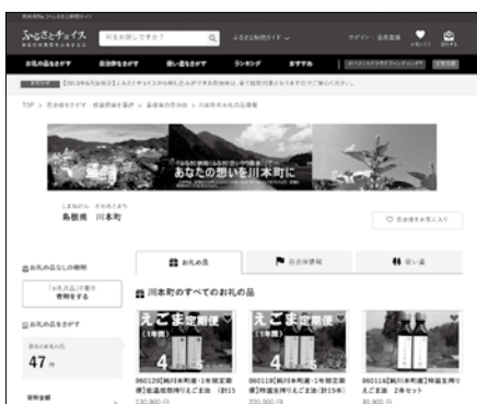
ふるさとチョイスの川本町ページ