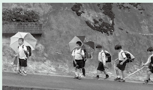
子どもたちが安全に通学できるよう点検しています