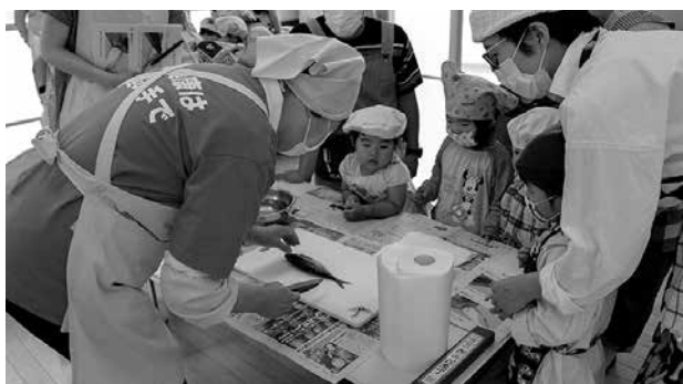
アジをさばく様子に興味津々の子供たち

因原保育所で『親子クッキング』が開催され、園児と父兄が旬の食材に触れながら料理を楽しみました。