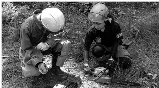
正しい知識で安全な作業を

川本町の林業の担い手育成を支援するため、「山をしり、林とかかわる基礎講座」と題したチェーンソーを使った研修会の第1回目を、北公民館と最寄りの町有林にて行いました。