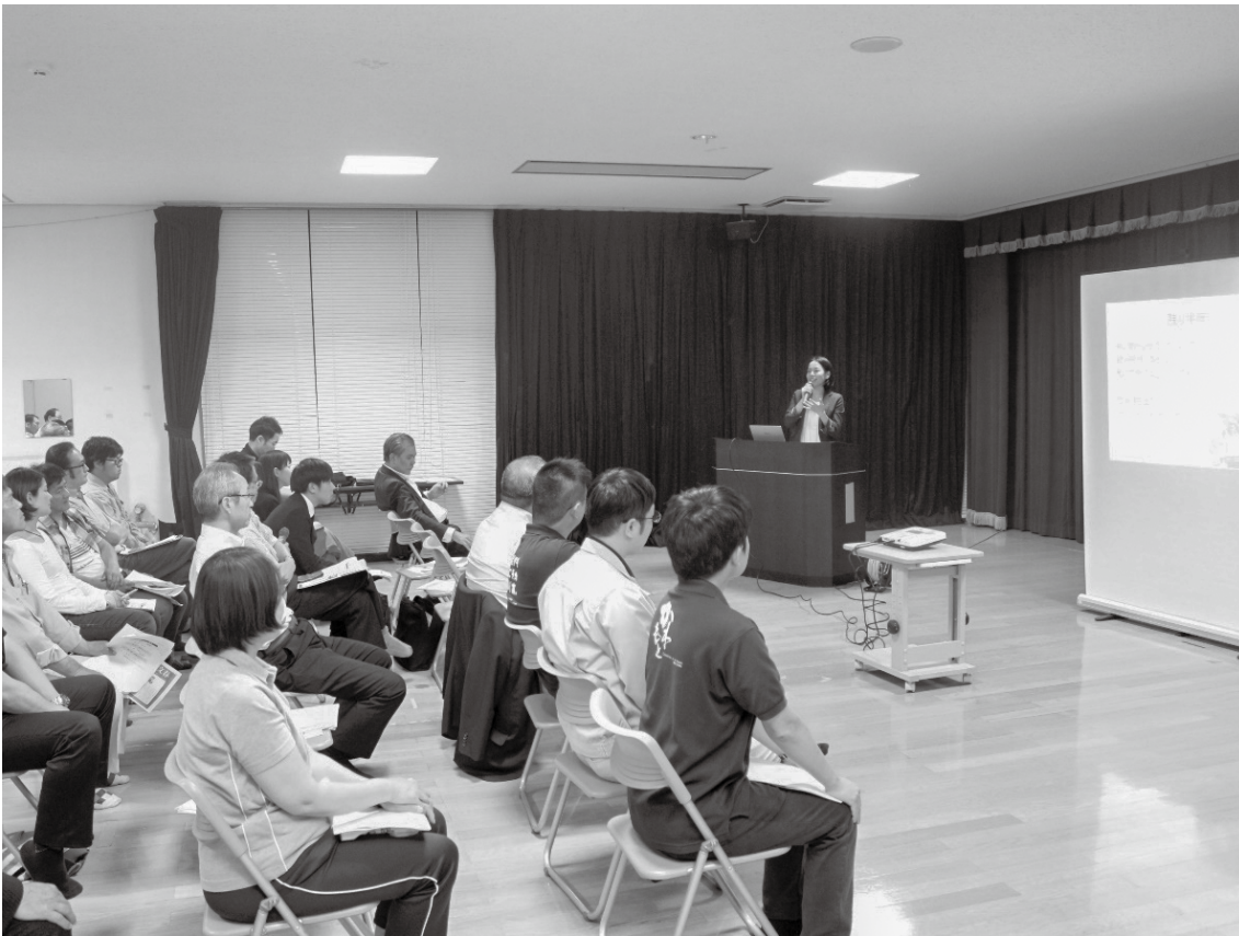
5月24日（金）、すこやかセンターかわもとで行われた「地域おこし協力隊活動報告会」では、任期3年目と任期満了を迎えた隊員による発表が行われました。