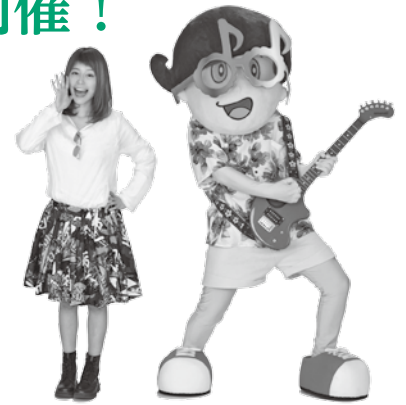
ゲスト ゆり&ドゲナッチョ

江の川では、恒例の『第68回江の川名物花火大会』も開催し、約2,500発の大輪の花が夏の夜空を彩り、山々に響き渡ります。ぜひ、お楽しみください♪