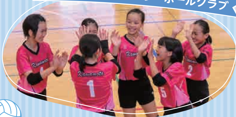
かわもとジュニアバレーボールクラブ