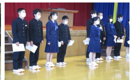
生徒会役員委嘱式