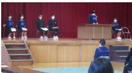
生徒会立会演説会