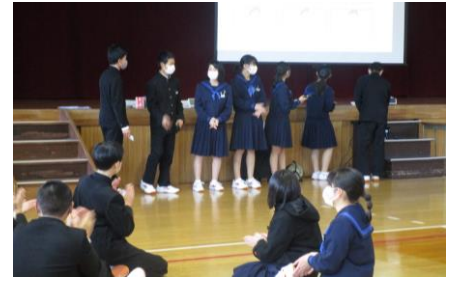
これからの川中生を考える会