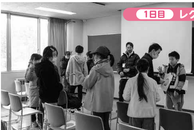
1日目 レクリエーション