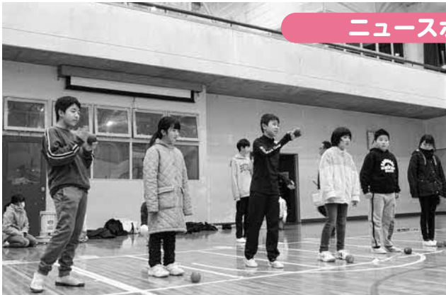
ニュースポーツ体験