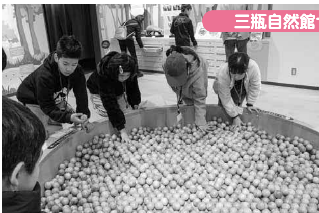
三瓶自然館サヒメル見学