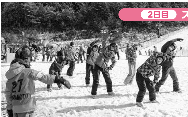
2日目 スキー交流会