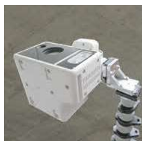
※ロボットカメラ本体