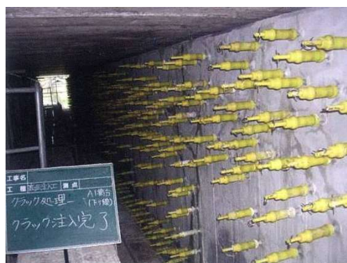
写真4-2 ひび割れ注入状況

ひび割れ部分にエポキシ樹脂材、ポリマーセメントなどの補修材料を深部まで注入し、ひび割れ部を塞ぐ工法です。ひび割れを塞ぐことにより、劣化因子（水分、塩化物など）の侵入を防止しコンクリートの耐久性を向上することができます。