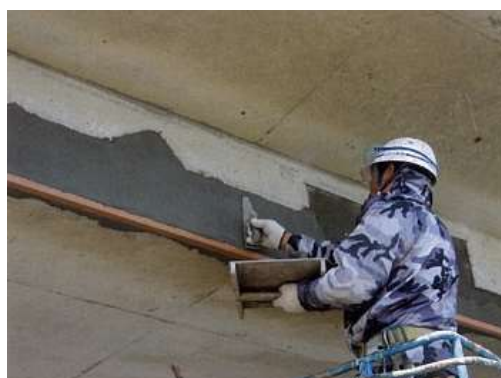
写真4-3 断面修復状況

欠損した断面を下地処理後、コテ、ヘラなどによって断面修復材を塗り込んで断面を修復する工法です。断面修復材料は、ポリマーセメントモルタルなどが用いられます。大規模な断面欠損箇所に対しては、吹付工法を採用することもあります。