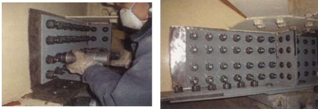
写真4-1 当て板工実施状況

激しい腐食による鋼部材の減厚が生じた箇所に対し、腐食箇所を取り囲むように当て板（添接版）を施すことにより鋼部材を補修する工法です。