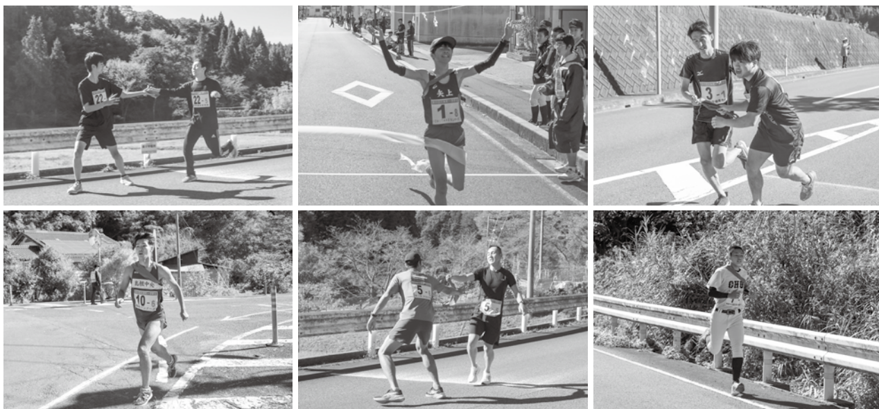
各チーム精一杯タスキを繋ぎました。