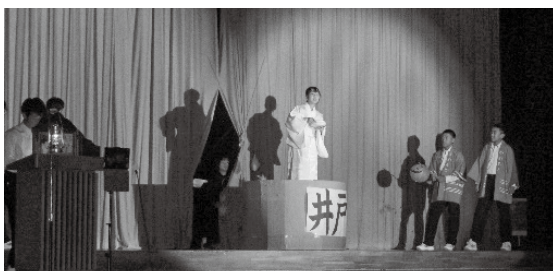
文化委員会による紙芝居劇