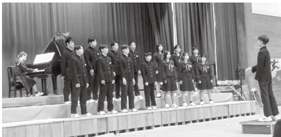
合唱フェスティバル