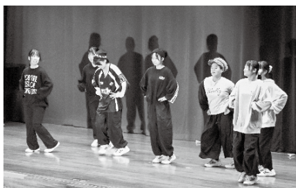
有志発表によるダンス