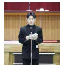
(右: 答辞の様子 下: 見送りの様子)