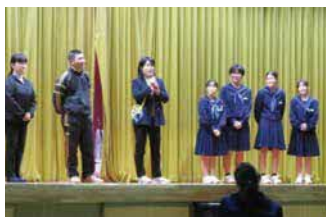
(メッセージタイム)