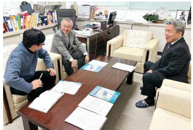
島根中央高等学校校長室にて

主権者教育は、選挙や政治の仕組みを学ぶだけでなく、地域社会に関心を持ち、自分の考えを深め、話し合いを通して社会に関わる力を育む効果も併せ持っています。この取り組みの第一歩として、